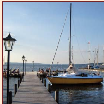
Coaching in Seeshaupt am Starnberger See